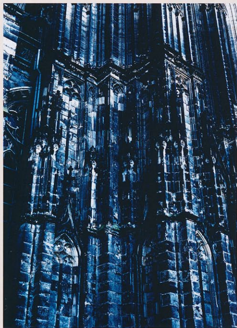
Rémy Marlot, Black churches , 2007, photographie couleur, 160 x 120 cm.

► Voir « Black Churches. Photographies de Rémy Marlot », Galerie photo du Pôle image Haute-Normandie, 15, rue de la Chaîne, Rouen (76), www.poleimagehn.com